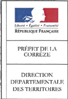
Schéma directeur d'utilisation du plan d'eau de Roche-le-Peyroux "Les Chaumettes" Règlement particulier de police de la navigation Arrêté préfectoral du 30 JAN. 2015