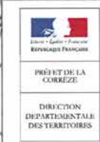
Schéma directeur d'utilisation de la retenue de Servièrès-le-Château "Feyt" Règlement particulier de police de la navigation Arrêté préfectoral du - 2 OCT. 2014 Sources INO@ Scan 25 2009 - DDT 19 - Soper - UE - 11/08/2014 polnav_sd_serviers_feyt_dp.wps